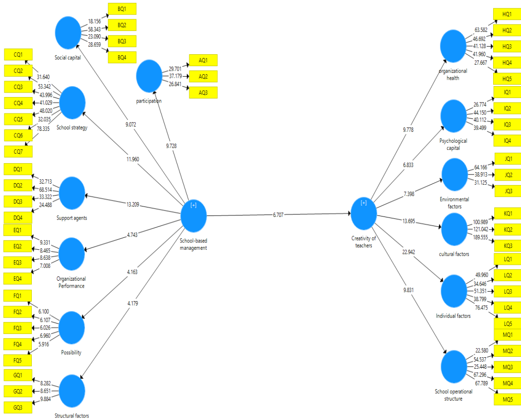
شکل ۲. مدل ساختاری پژوهش در حالت معنی داری