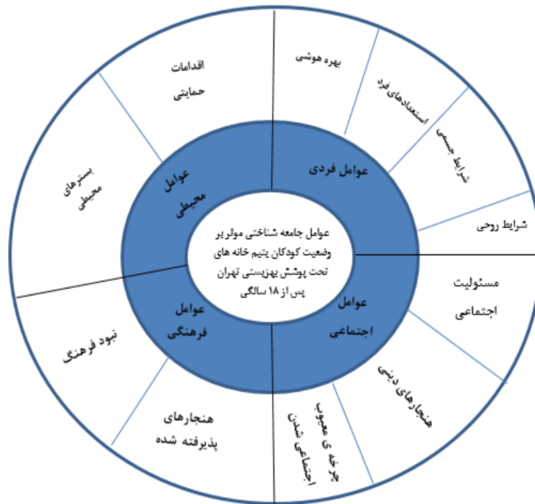
شکل ۲. الگوی استخراج شده عوامل جامعه شناختی موثر بر وضعیت کودکان یتیم خانه های تحت پوشش بهزیستی تهران پس از ۱۸ سالگی