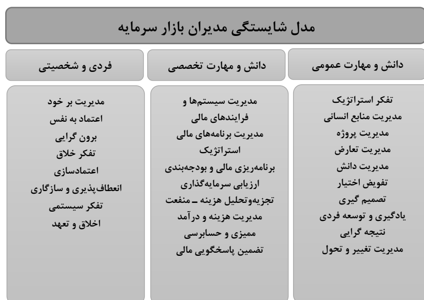
شکل ۱. مدل شاخص‌های شایستگی مدیران بازار سرمایه

۰/۷۳۰ می‌باشد. همانطور که نتایج آزمون برای ابعاد نشان می‌دهد سطح معناداری (sig) در تمامی متغیرها کمتر از ۰/۰۵ است. این نشان می‌دهد که توزیع نرمال نمی‌باشد. یعنی بین تابع توزیع تجمعی مشاهده‌شده و نظری تفاوت وجود دارد. نتایج آزمون برای مولفه‌ها نیز نشان می‌دهد که سطح معنی‌داری برای متغیرهای سوم و هفدهم بیش از ۰/۰۵ و برای متغیرهای دیگر کمتر از ۰/۰۵ می‌باشد. در ادامه تعیین درجه اهمیت ابعاد و مولفه‌های مدل به کمک آزمون تک‌تک نمونه‌ای انجام گرفته که در این آزمون، فرض بر این است نمونه‌ای با حجم n و میانگین m از یک جامعه انتخاب شده که این نمونه یک نمونه تصادفی از جامعه-ای با میانگین \mu است. در این آزمون باید توزیع داده‌ها به صورت نرمال باشد و یا اینکه تعداد نمونه‌ها زیاد باشد تا بتوان آن را نرمال فرض کرد. با توجه به اینکه در این پژوهش تعداد خبره‌ها (نمونه‌ها) ۳۰ می‌باشد پس می‌توان از آزمون t استفاده کرد. مطابق جدول (۹) و (۱۰)، میانگین تمامی ابعاد و مولفه‌ها بیشتر میانه مولفه‌ها (عدد ۳) است. سطح معنی‌داری برای تمام ابعاد و مولفه‌ها کوچک‌تر از ۰/۰۵ است. یعنی میانگین ابعاد و مولفه‌ها به صورت معناداری از عدد ۳ بزرگ‌تر است و به عبارت دیگر از دید خبرگان تمام ابعاد و مولفه‌های معرفی شده از اهمیت بالایی برخوردارند. بر این اساس پس از مطالعه ادبیات، تجزیه و تحلیل آماری، مدل شامل سه بعد و ۲۶ مؤلفه برای شایستگی مدیران بازار سرمایه بدست آمده که در شکل (۱) نشان داده شده است.