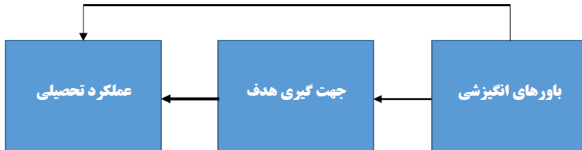
نمودار ۱: نمودار مفهومی پژوهش

ارائه شده است. در این مدل؛ باورهای انگیزشی (خودکارآمدی، ارزشگذاری درونی و اضطراب امتحان) به عنوان متغیرهای برون زاء، انواع جهت گیری هدف (اهداف تسلط گرایی، تسلط اجتنابی، عملکرد گرایی و عملکرد اجتنابی) به عنوان متغیر های واسطه و عملکرد تحصیلی به عنوان متغیر درونزا در نظر گرفته شده است.